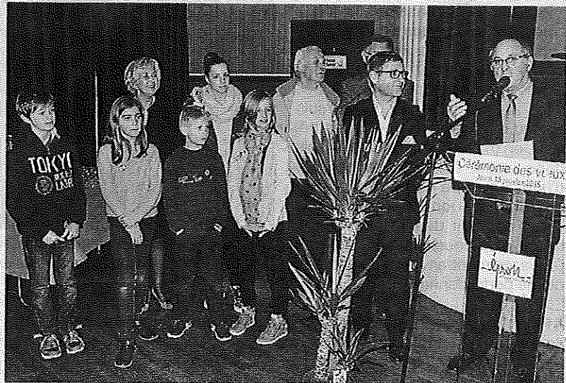
Les jeunes élus du conseil municipal des enfants étaient associés aux vœux du maire

der son identité de village. « Nous serons contraints de faire des emprunts pour la construction du restaurant. Le taux d'endettement est