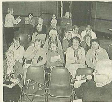
Un programme riche pour 2015.